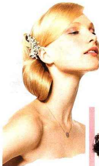
Glamour hollywoodien. Coiffure Nick Malenko @ Royston Blythe (Royaume-Uni) L'Oréal Professionnel.

VOYAGE DE NOCES. Une chambre avec vue sur un glacier, un lodge dans la savane, un voyage dans un train de légende, un hôtel au Mexique construit sur l'eau alimenté par des éoliennes... Les destinations originales ne manquent pas! Ou, dans un autre genre, une lune de miel solidaire moitié farniente-moitié immersion dans la population... Certains voyageurs construisent des programmes selon vos envies, hors catalogue. Renseignez-vous.